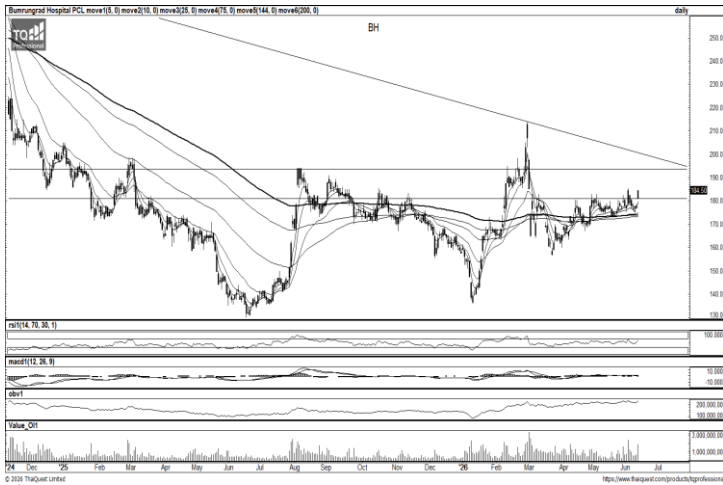
ที่มา; TQ Professional