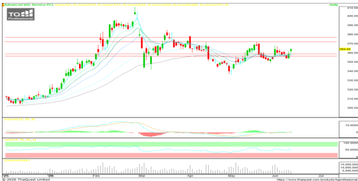
มา ; TQ Professional