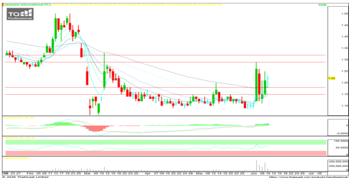
มา ; TQ Professional