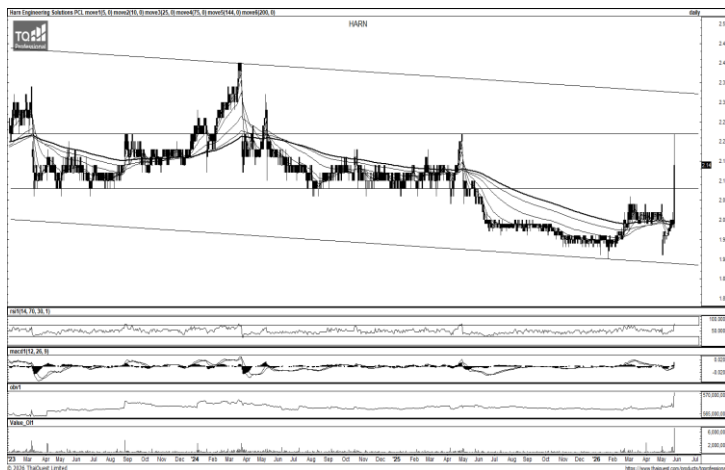
ที่มา; TQ Professional

แนะนำถึงกำไร แท่งเทียนทำจิ้งหะขึ้นสลับพัก พร้อมปริมาณการซื้อขายทยอยเข้าสะสม ส่วน MACD / RSI ชัยบในทิศทางบวก หากยืนแนวรับ 1.39 บาท ได้คาดเห็นการขยับขึ้นต่อ โดยมีแนวต้านบริเวณ 1.67-2.00 บาท ส่วนจุด Stop Loss วางไว้ที่ 1.35 บาท