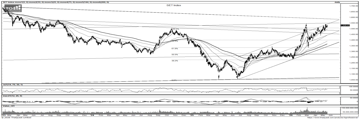
ที่มา: TQ Professional, Day