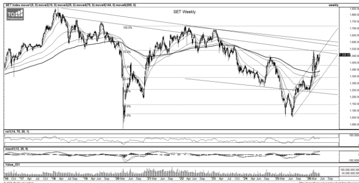
ที่มา: TQ Professional, TF weekly

กลยุทธ์การลงทุน SET Index ปรับตัวขึ้นชนแนวต้านตาม channel ที่ 1,530 ยังไม่ผ่าน ด้าน Indicator ประคองตัวบวก มองแนวโน้ม sideways up วางแนวรับ 1,505/1,495 ส่วนแนวต้าน 1,515/1,530