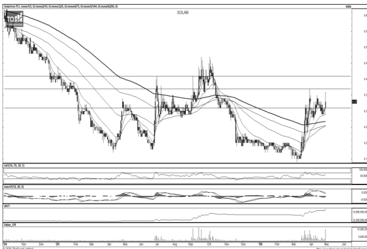
ที่มา : TQ Professional

แนะนำแก๊งก์ไอ แ่งเทียนฟื้นตัวจากบริเวณ EMA200 วัน พร้อมปริมาณการซื้อขายทยอยเข้าสะสม ส่วน MACD / RSI ชัยบในทิศทางบวก หากยืนแนวรับ 3.12 บาท ได้คาดเห็นการฟื้นตัวขึ้นต่อ โดยมีแนวต้านบริเวณ 3.42-3.72 บาท ส่วนจุด Stop Loss วางไว้ที่ 3.06 บาท