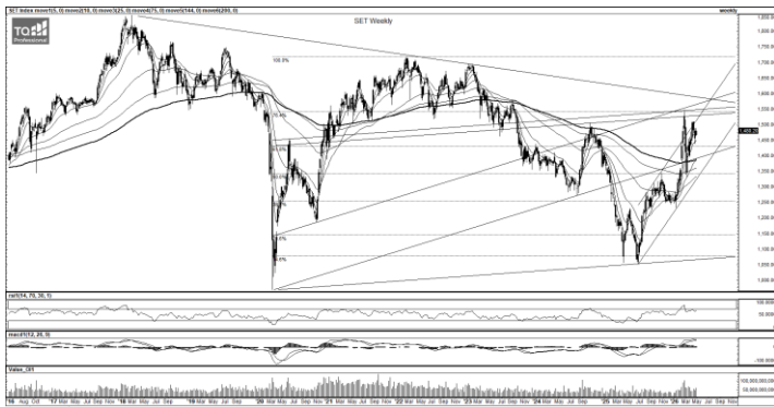
ที่มา: TQ Professional, TF weekly

กลยุทธ์การลงทุน SET Index ปิดทรงตัวเหนือ EMA ระยะสั้น ด้าน Indicator ดีขึ้นตามลำดับ ประเมินแนวโน้ม sideways up โดยมีแนวรับ 1,475/1,465 ส่วนแนวต้าน 1,490/1,500