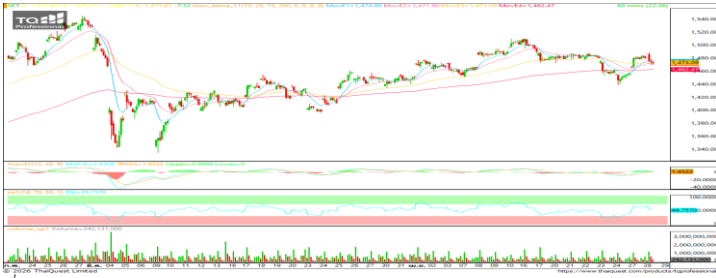
ที่มา ; TQ Professional 60 Mins