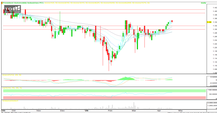
มา ; TQ Professional