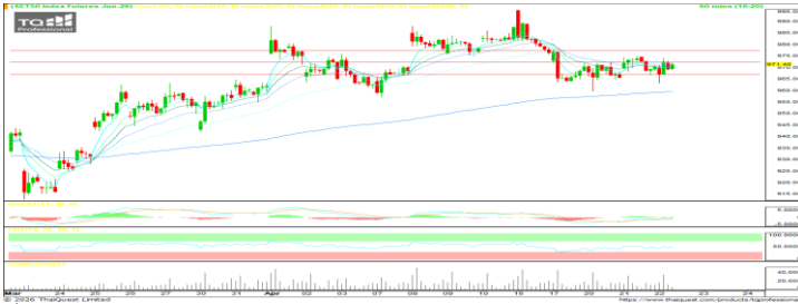
ที่มา ; TQ Professional 60 Mins