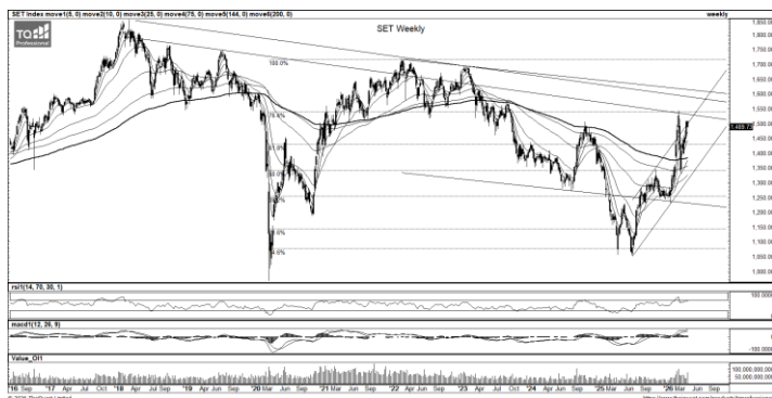
ที่มา: TQ Professional, TF weekly

กลยุทธ์การลงทุน SET Index แท่งเทียนประกอบตัวในกรอบขาขึ้น โดยมีสัญญาณบวกของ Indicator สนับสนุน แนวโน้ม sideways up ประเมินแนวต้านบริเวณ 1,500/1,510 แนวรับ 1,485/1,475