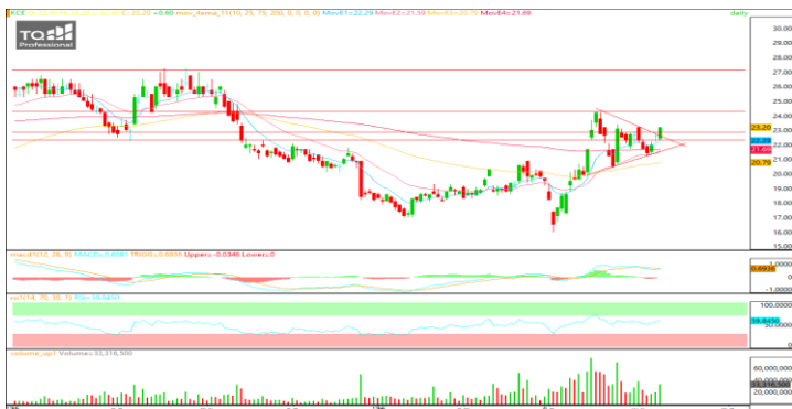
ที่มา : TQ Professional

แนะนำซื้อเก็งกำไร ระดับราคาขึ้นเข้าใกล้ทดสอบเส้นค่าเฉลี่ย EMA 75 วัน ด้าน Volume มีสะสม ขณะที่ Indicators หันหาโซนบวก พิจารณา Trading Buy วางแนวรับบริเวณ 7.80 – 7.90 บาท วางแนวต้านทำกำไรบริเวณ 8.10 – 8.30 บาท หากราคาเคลื่อนไหวต่ำกว่า 7.75 บาท แนะนำ Stop-Loss