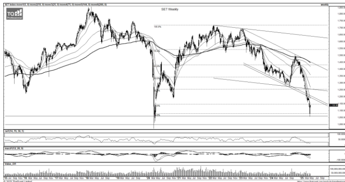
ที่มา: TQ Professional, TF weekly

กลยุทธ์การลงทุน SET Index ประคองตัวเหนือ EMA10 วัน สอดคล้อง RSI / MACD ที่ดีขึ้น วันนี้คาดทดสอบ trend line หากผ่านได้เป็นสัญญาณบวก ประเมินแนวต้าน 1,147/1,157 แนวรับ 1,129/1,119