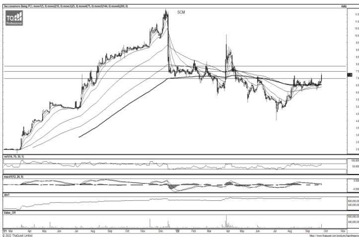
ที่มา ; TQ Professional

แนะนำเก็งกำไร แท่งเทียนทยอยปรับตัวขึ้นเหนือ EMA200 วัน พร้อมปริมาณการซื้อขายเข้าสะสม ประกอบกับสัญญาณ MACD ที่มีโมเมนตัมเชิงบวก ระยะสั้นหากพักตัวมีแนวรับ 1.41 บาท ยืนได้มีแนวต้านถัดไป 1.48-1.50 บาท และวางจุด Stop Loss อยู่ที่ 1.38 บาท