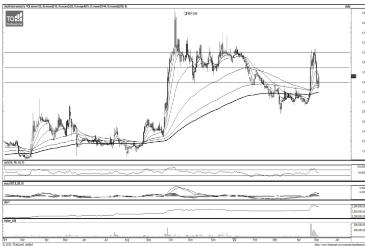
ที่มา : TQ Professional

แนะนำแก๊งก์กำไร แท่งเทียนปรับตัวขึ้นต่อเนื่องหลังผ่าน EMA200 วัน พร้อมปริมาณการซื้อขายเข้าเพิ่มมากขึ้น ด้าน สัญญาณ RSI และ MACD กำลังปรับตัวเชิงบวก เบื้องต้นหากยืนยันแนวรับบริเวณ 31.00 บาท ได้มีโอกาสขึ้นทดสอบแนวต้านถัดไปที่ 35.50-38.00 บาท ส่วน Stop Loss 30.00 บาท