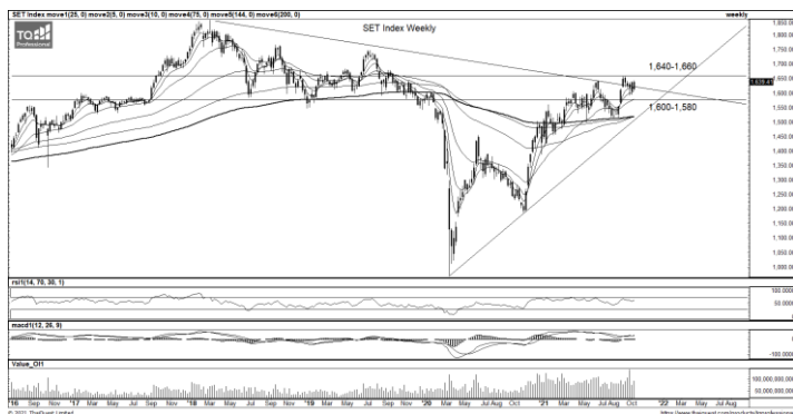
ที่มา: TQ Professional, TF weekly

กลยุทธ์การลงทุน TF60min แท่งเทียนแกว่งขึ้นภายในกรอบ Uptrend เหนือ EMA10 คาดระยะสั้นมีแนวโน้มทยอยปรับขึ้นต่อมีแนวต้าน 1,645-1,650 จุด ส่วนแนวรับขยับขึ้นมาที่บริเวณ 1,635-1,630 จุด