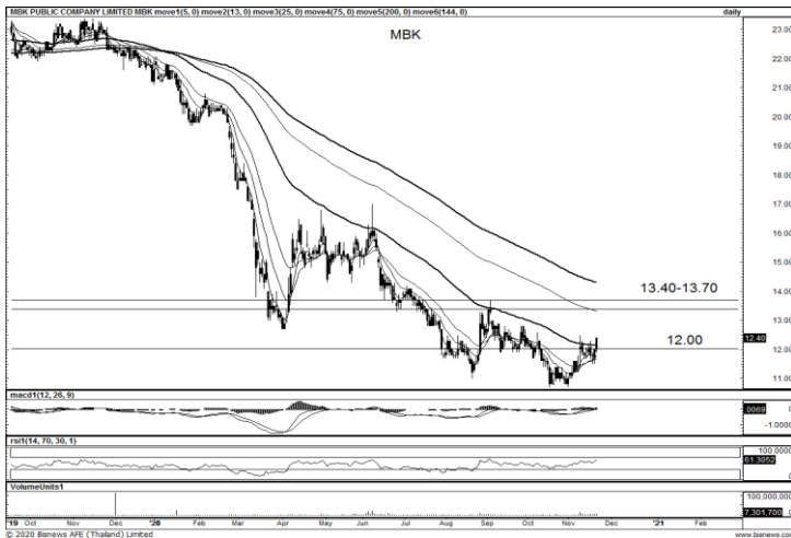
ที่มา ; BISNEWS

แนะนำซื้อแก๊งกำไร แท่งเทียนทำจิ้งหะทยอยแก่งขึ้น พร้อมด้วยปริมาณการซื้อขายทยอยเข้าสะสม เบื้องต้นดูแนวรับ 35.00 บาท ยืนได้มีเป้าหมายการขึ้นต่อบริเวณเส้น EMA 200 วัน แนวต้าน 38.50 บาท และกำหนดจุด Stop Loss ที่ 34.50 บาท