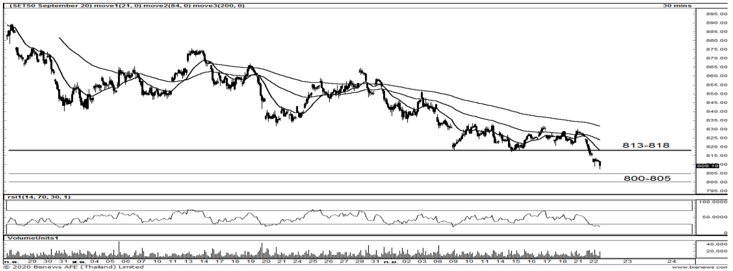
* Time Frame 30 Minute