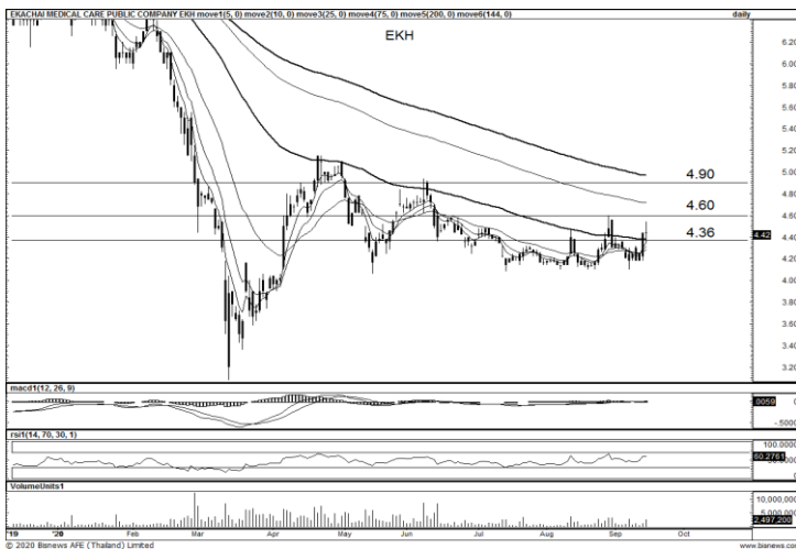
ที่มา ; BISNEWS

แนะนำซื้อเก็งกำไร แท่งเทียนประคองตัว Sideways Up เหนือเส้นค่าเฉลี่ยระยะสั้น มาพร้อมปริมาณการซื้อขายทยอยเข้าสะสม ลุ้นเห็นราคายกตัวขึ้นต่อมีแนวต้าน 1.94-2.00 บาท ส่วนแนวรับ 1.80 บาท และวางจุด Stop Loss ที่ 1.77 บาท