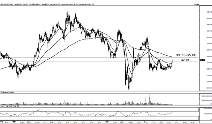
ที่มา ; BISNEWS

แนะนำซื้อเก็งกำไร ราคา Sideway up และกำลังทดสอบเส้นค่าเฉลี่ย EMA 200 วัน หนุนด้วยปริมาณการซื้อขายที่ไหลเข้ามาหนาแน่น เราจึงแนะนำให้ Follow Buy วางแนวต้านไว้ที่บริเวณ 5.30-5.50 บาท ส่วนแนวรับ 5.00 บาท และ Stop Loss ถ้าราคาปรับตัวลงต่ำกว่า 4.90 บาท